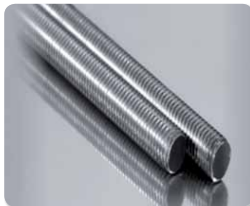
149. Varilla roscada A2/304