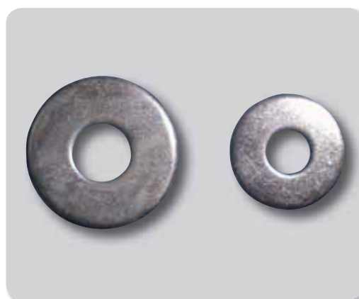
151. Arandela DIN 9021 A2/304