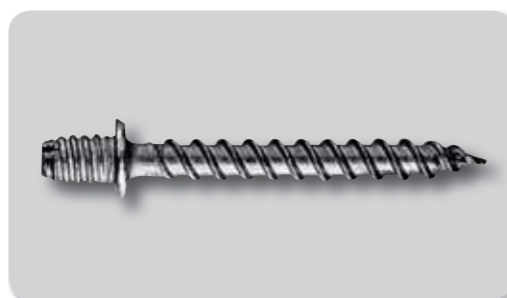
152. Tornillo doble rosca A2/304