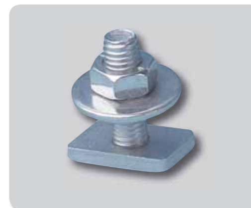
154. Tope guia A2/304