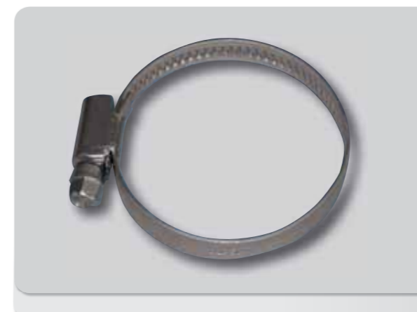
146. abrazadera sin fin A2/304

- ACABADO: INOX 304 2B. - DIMENSIONES: 20 X 1,5 MM - TUERCA SOLDADA: M-8 Ø M-10 - TORNILLO: DIN 7985 M-5 Ø M-6 - CAUCHO: EPDM