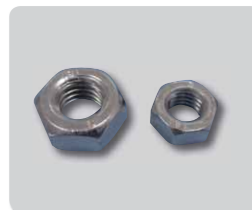
148. Tuerca Din 934 A2/304