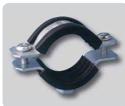
145. abrazadera M-8/10 isofonica A2/304

- ACABADO: INOX 304 2B. - DIMENSIONES: 20 X 1,5 MM - TUERCA SOLDADA: M-8 Ø M-10 - TORNILLO: DIN 7985 M-5 Ø M-6