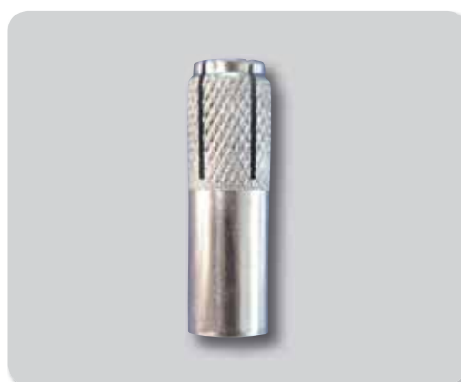
150. Anclaje hembra A2/304