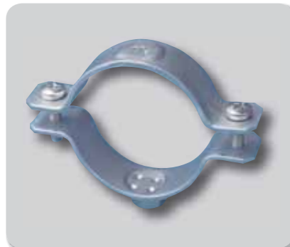
144. abrazadera M-8/10 reforzada A2/304