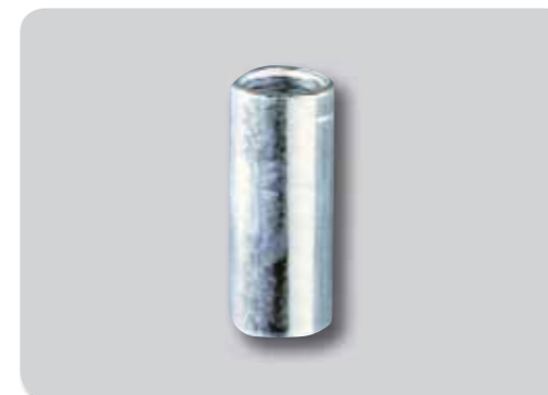
153. Manguito roscado A2/304