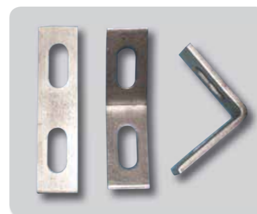
156. Escuadras y empalmes A2/304