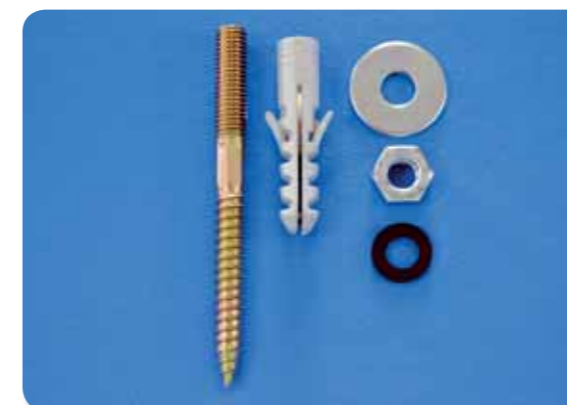
143. Fijacion lavabo a la pared