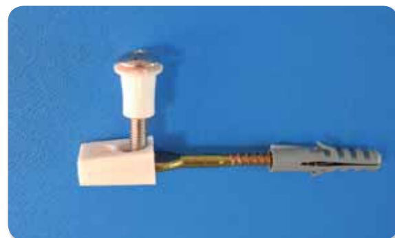
138. Fijacion horizontal inodoro

- CONJUNTO DE TORNILLO HEXAGONAL CON TACO DE EXPANSION PROLONGADA , QUE GARANTIZA UNA MEJOR AGARRE, CON ALETAS PARA UN CORRECTO AGARRE Y SISTEMA ANTIGIRO