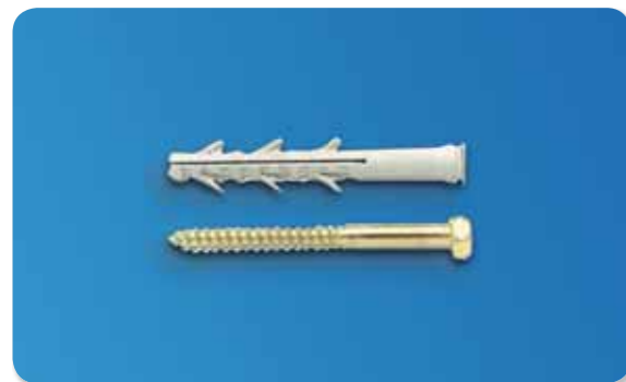
137. Juego tornillo + taco a percusión