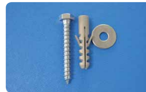
141. Fijacion calentador con tornillo