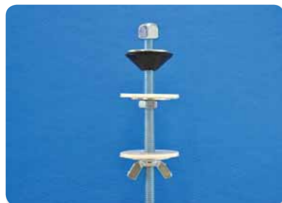
140. Fijacion taza - tanque