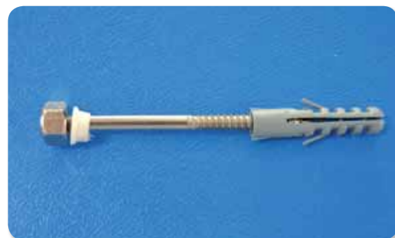
139. Fijacion vertical inodoro inox