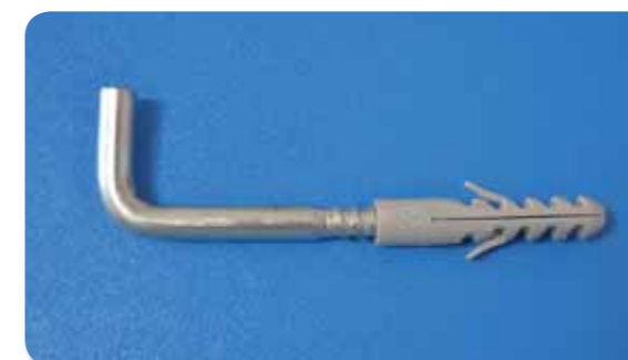
142. Fijacion calentador con alcayata